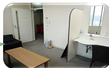
女性専用ラウンジ