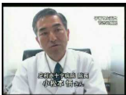
NHK クローズアップ現代 女性医師をいかせ ～医師不足対策の新戦略～ 2008年6月18日(水)